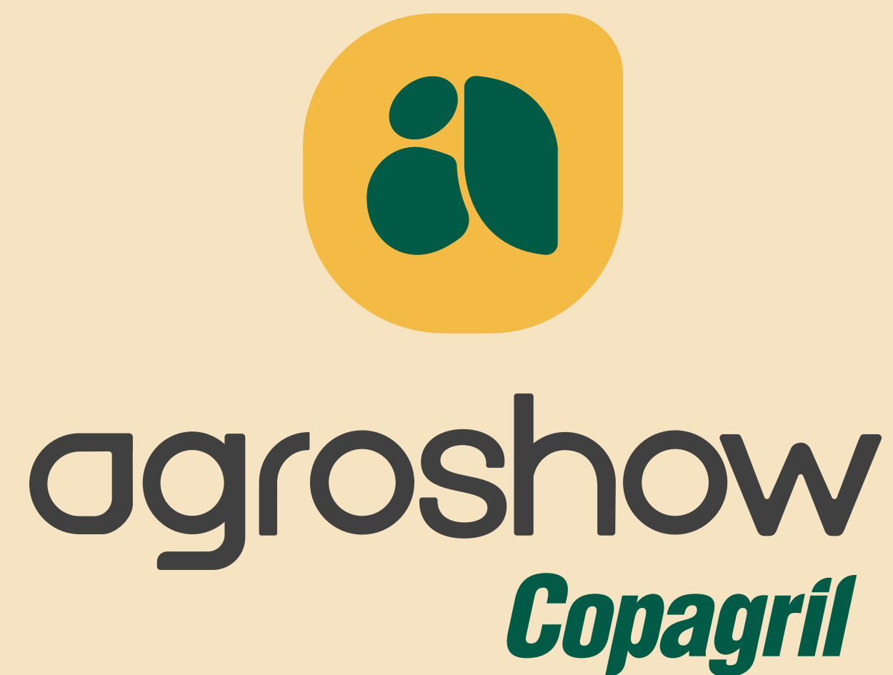
Versão principal vertical