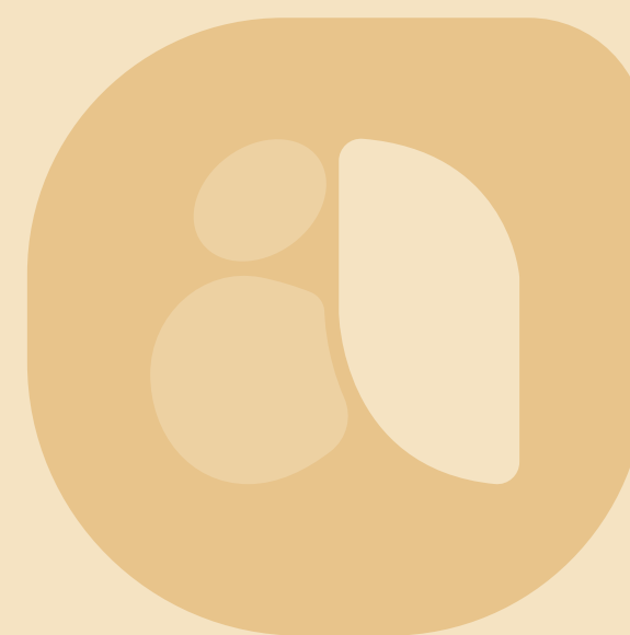
Grão/folha de trigo